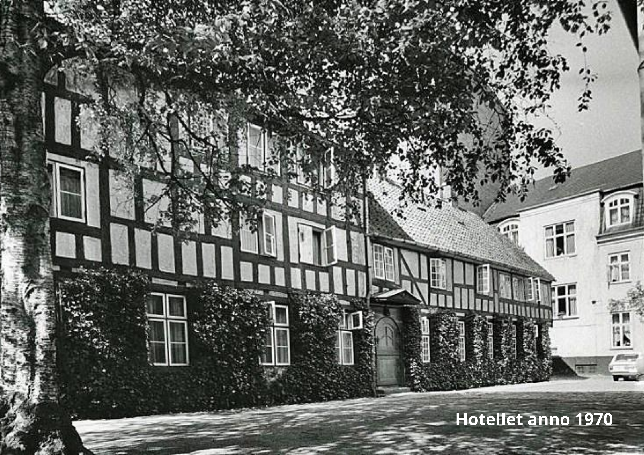
Hotellet anno 1970