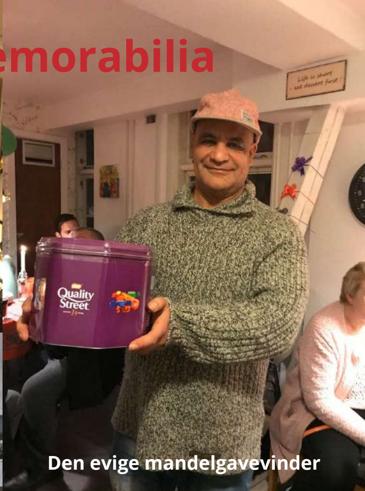
Den evige mandelgavevinder