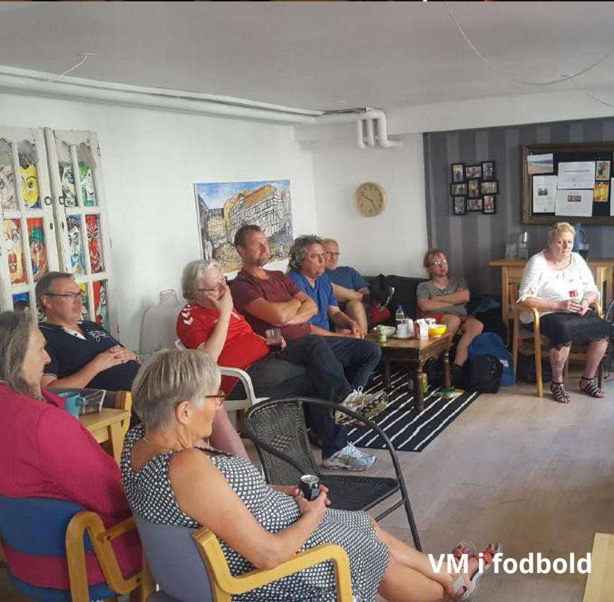
VM i fodbold