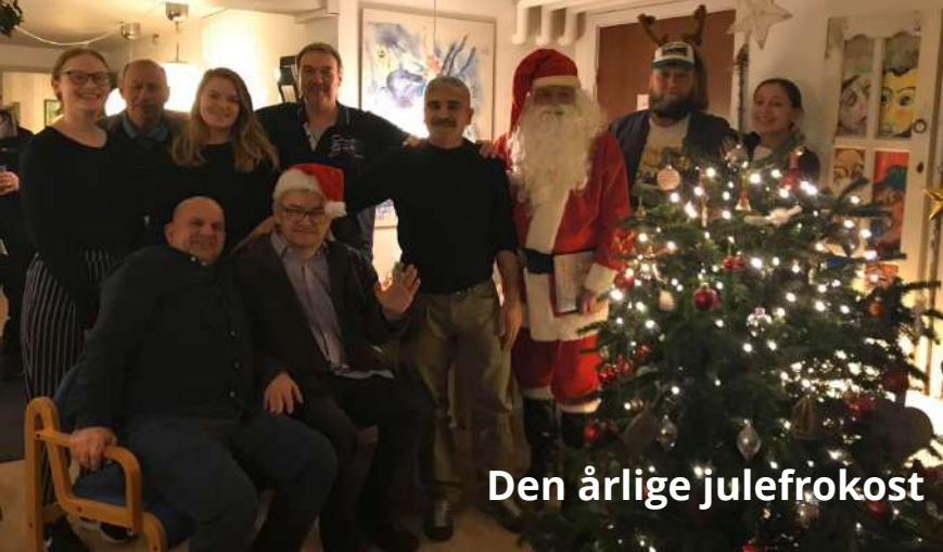
Den årlige julefrokost