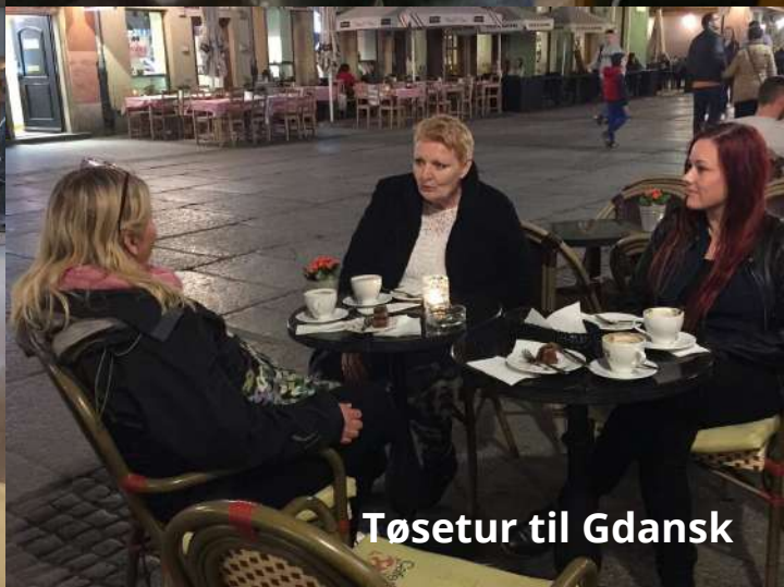
Tøsetur til Gdansk